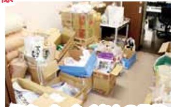
永久津いきいき協議会様