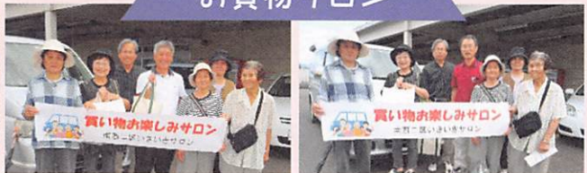
買い物楽しみサロン