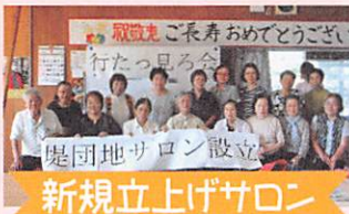
新規立上げサロン