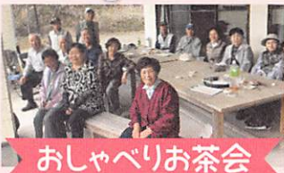
おしゃべりお茶会

公民館や集会所、個人宅、会社の空きスペース等で食事会やおしゃべりお茶会、レクリエーション、認知症予防の軽体操などを、住民主体で開催する活動で、気軽に、無理なく、楽しい時間をすごす場所となります。 *現在、市内で約100団体が活動中です。