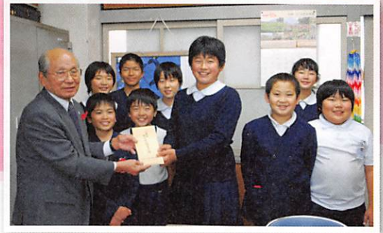
西小林小学校より