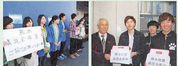
熊本県内の大学に在学する小林市近隣出身の学生ボランティアによる街頭募金活動