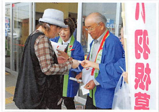
街頭募金 (コープみやざき小林店)